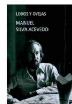
LOBOS Y OVEJAS Año: 1976 Editorial: Ediciones UDP (2009)