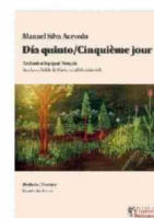
DÍA QUINTO Año: 2002 Editorial: El Español de Shakespeare (2024)