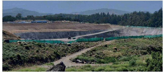
LA EMPRESA IMPLEMENTÓ un refuerzo en el resguardo de sus faenas, con aumento de guardias, mejoras en vigilancia y sistemas como control de accesos y monitoreo tecnológico tras el atentado.

"La compañía mantiene la confianza y convicción de que la Central es un proyecto importante y con proyección futura", cerraron.