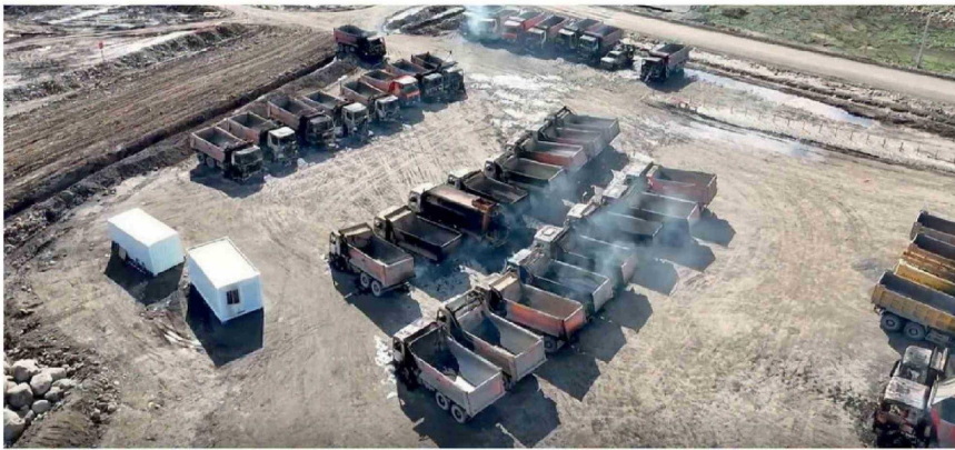
EL ATAQUE INCENDIARIO ocurrido el 20 de abril de 2025 dejó 45 camiones y cinco maquinarias destruidas, además de dos guardias lesionados en faenas de la central.

Este lunes 20 de abril se cumplen 12 meses del ataque incendiario que dejó 45 camiones y maquinaria destruidos en la Central Hidroeléctrica Rucalhue, el que provocó retrasos en su construcción y el reforzamiento de resguardo obligatorio, en un contexto donde la investigación continúa sin resultados públicos.