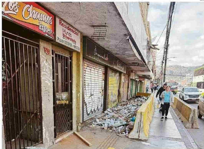
ESCOMBROS DEL SINIESTRO Y BASURA HAN PROVOCADO PLAGA DE RATONES Y MOSCAS