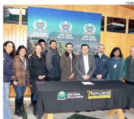
EL ACUERDO APORTA AL DESARROLLO RURAL DE SAN JUAN DE LA COSTA.