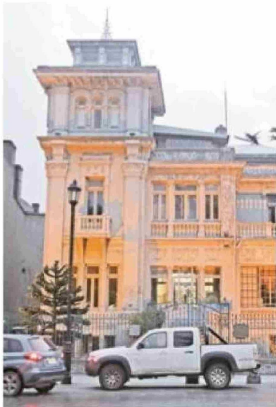
En el puesto 191 figura la Municipalidad de Punta Arenas, con 39 licencias cuestionadas.

La Municipalidad de Natales aparece en el puesto 131 del ranking, con 68 licencias. Desde el municipio se informó que evaluarán cada caso y que instruirán los sumarios correspondientes. "No descartamos llegar hasta la Fiscalía en caso de haber perjuicio económico",