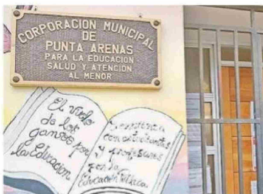
La Cormupa ocupa el noveno lugar con 369 licencias.

En el consolidado liberado por Contraloría, la primera institución magallánica que aparece es la Corporación Municipal de Salud y Menores de Puerto Natales, en el octavo lugar, con 392 licencias. "Tenemos Rut que se repiten cinco o seis veces", indicó la alcaldesa