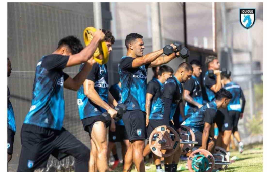
Un exigente trabajo de fuerza forma parte de los entrenamientos físicos del plantel celeste.

Tras el inicio de Copa Chile en la segunda quincena/últimos días de enero —según la planificación oficial difundida para la temporada— el foco se traslada rápidamente al torneo de Primera B (Liga de Ascenso), cuyo arranque está establecido para el 16 de febrero. Es decir: no hay "mes de margen" entre una competencia y otra. Hay semanas. Hay días. Hay microciclos. Y hay una verdad de fútbol: cuando compites seguido, el estado físico no se construye,