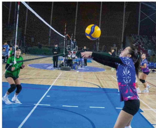
MÁS DE 1.500 ESTUDIANTES de distintas regiones del país competirán en esta segunda edición.

Actualmente, Chile cuenta con 400 liceos bicentenario que albergan a más de 21.000 docentes y 300.000 estudiantes, distribuidos en las 16 regiones del país.