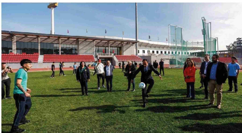
TRAS EL LANZAMIENTO de las olimpiadas, las autoridades pusieron en práctica una de las disciplinas que estarán en competencia.

“Tener esta olimpiada nuevamente y poder recibir a niños y niñas en estos maravillosos recintos representa un gran