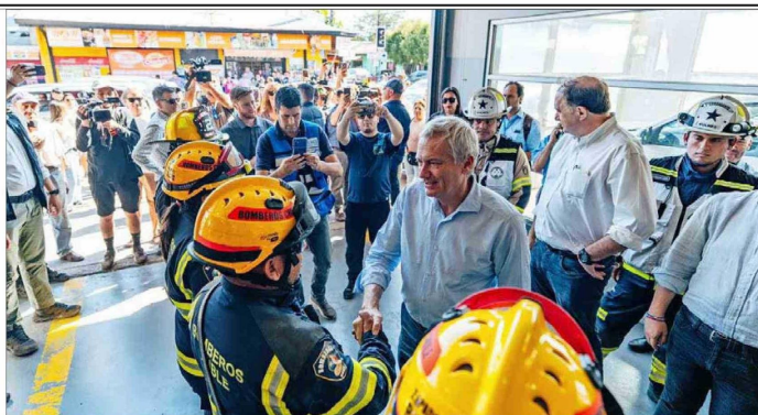
PRESIDENTE ELECTO. — En paralelo al viaje de Gabriel Boric, José Antonio Kast llegó hasta Nuble y Biobío, donde se reunió con vecinos.

Llegaron a comunas de las regiones de Ñuble y Biobío: