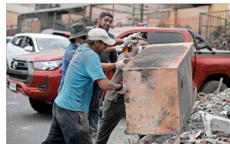
LIMPIEZA. — En Lirquén, vecinos, familiares y voluntarios han realizado esta semana tareas para levantar y mover escombros.

Para Sergio Baeriswyl, premier nacional de Urbanismo, la Fibe “es el dato más confiable. Esperaría que por la urgencia de esto, en los próximos días esté ya disponible o informable porque terminada la aplicación de ella, recién ahí se canalizan las ayudas; por lo tanto, la urgencia es máxima”.