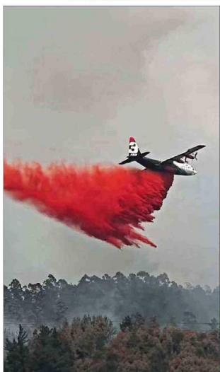
COMBATE. — En distintas zonas del sur, incluyendo La Araucanía, Biobío y Ñuble, se registran fuertes siniestros forestales. Ayer, Florida era una de las más impactadas.

En la primera comuna conversó con vecinos y afirmó que “no tenemos hoy las herramientas para enfrentar esto nosotros como equipo la emergencia, pero sí queremos prepararnos