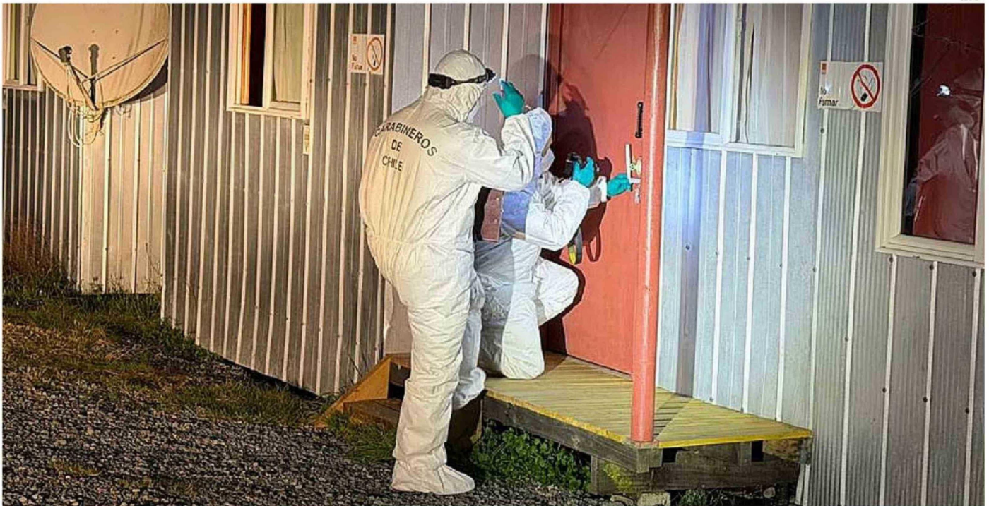
A LA SECCIÓN OS-9 Y AL LABOCAR DE CARABINEROS SE LES ENCARGARON LOS PERITAJES DEL NUEVO CASO DE SECUESTRO EN LA REGIÓN DE LOS LAGOS.