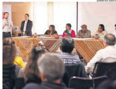
EL MINISTRO FIGUEROA DESTACÓ EL DIÁLOGO CON LOS PUEBLOS INDÍGENAS.

“Se ha avanzado en la región además, en el trabajo de identificación, estudio y reserva de nuevos terrenos fiscales que sean para proyectos habitacionales”.