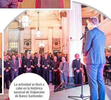
La actividad se llevó a cabo en la histórica sucursal de Valparaíso de Banco Santander.