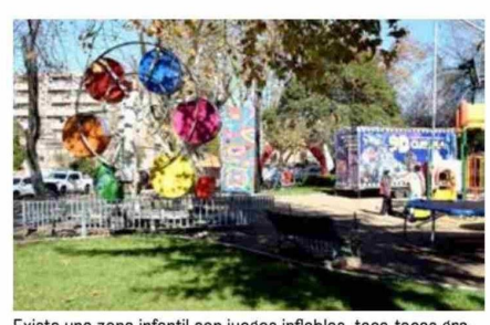
Existe una zona infantil con juegos inflables, taca-tacas gratuitos, mini cancha, rueda de la fortuna pequeña, cine 9D y un muro de escalada, para que los más pequeños disfruten del evento.