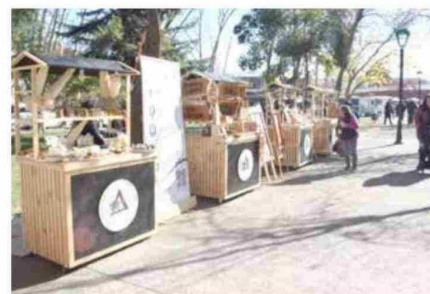
Al hacer el recorrido también se puede visitar una feria de emprendedores locales, que poseen diversos productos artesanales y personalizados con el motivo de la fiesta.