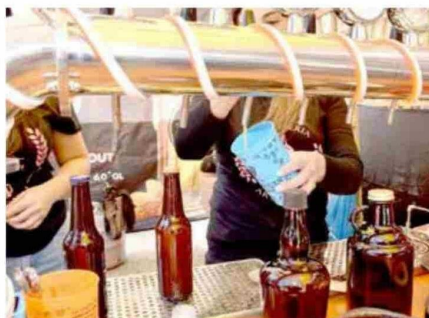
En este evento también hay un patio cervicero, con proveedores de cervezas artesanales e industriales.