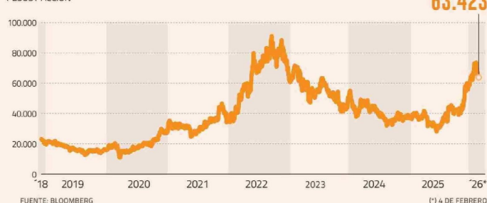
ACCIÓN DE SQM-B PESOS / ACCIÓN