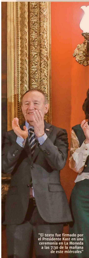
"El texto fue firmado por el Presidente Kast en una ceremonia en La Moneda a las 7:30 de la mañana de este miércoles"

(*) CIFRAS POSITIVAS/NEGATIVAS IMPLICAN QUE EL FLUJO ESTIMADO (DE INGRESO O GASTO) CONTRIBUYE POSITIVA/NEGATIVAMENTE AL BALANCE FISCAL. FUENTE: DIRECCIÓN DE PRESUPUESTOS (DIPRES).