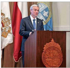
El Presidente electo, José Antonio Kast, durante su exposición.