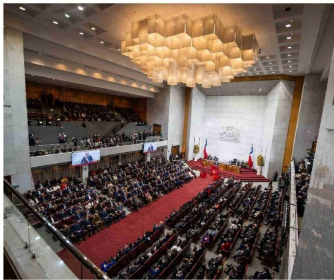
► En su discurso, el Mandatario anunció varias medidas en temas de seguridad.

A lo largo de su discurso, el mandatario mencionó 29 veces las palabras “seguri-