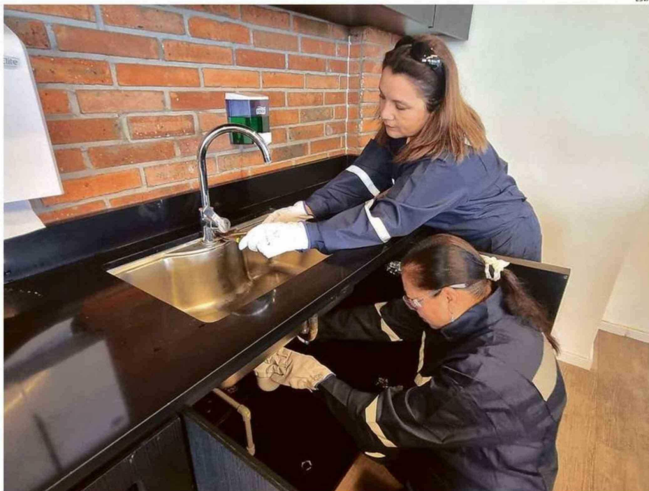
EL PROGRAMA CUENTA CON 44 CUPOS PARA MUJERES DE TODA LA REGIÓN

tiene postulacio- asta el 8 de marzo. enes espera una edición de "Fe- rias que Inspiran".