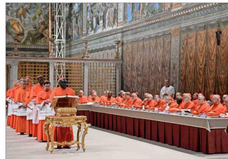
LOS 133 CARDENALES que deben elegir al sucesor del Papa Francisco juraron en la Capilla Sixtina guardar el secreto de su votación y de todas las discusiones del cónclave. Los purpurados pronunciaron el juramento juntos y luego cada uno se acercó de nuevo al altar para jurar de nuevo de forma individual con la mano sobre el Evangelio.

La demora no fue la única "señal" que sembró las especulaciones. Por la mañana, en la misa "Pro Eligendo Pontifice"—previo al inicio oficial del cónclave—se escuchó al decano del Colegio Cardenalicio, monseñor Giovanni Battista Re, desearle "suerte" a uno de los papables más conocidos, el italia-