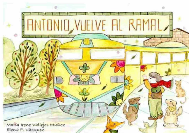
La obra propone un recorrido íntimo y sensible por este emblemático tren.