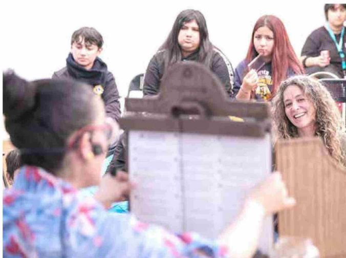
El arte del kamishibai —teatro de papel de origen japonés— también atrae el interés de adultos.