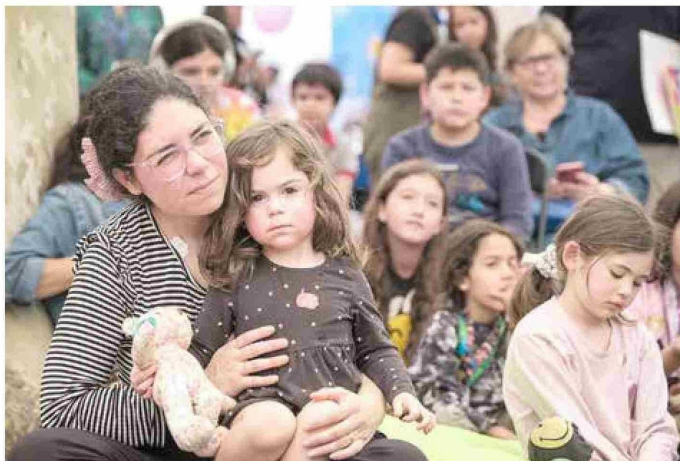
Cada presentación genera expectación entre los asistentes.