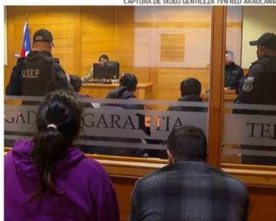
LOS ADOLESCENTES QUEDARON EN LIBERTAD, PERO CON LA CAUTELAR DE DERIVACIÓN ASISTIDA.