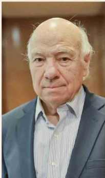
VITTORIO CORBO, EXPRÉSIDENTE DEL BANCO CENTRAL.

“No hay evidencia respecto de su impacto en el crecimiento; rigidiza las políticas tributarias”.