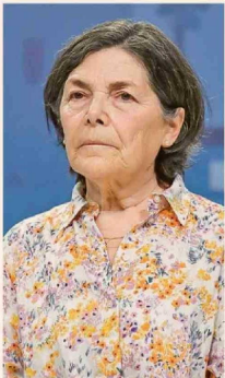
PAULINA SABALL, EXMINISTRA DE ESTADO.

“No hay evidencia respecto de su impacto en el crecimiento; rigidiza las políticas tributarias”.