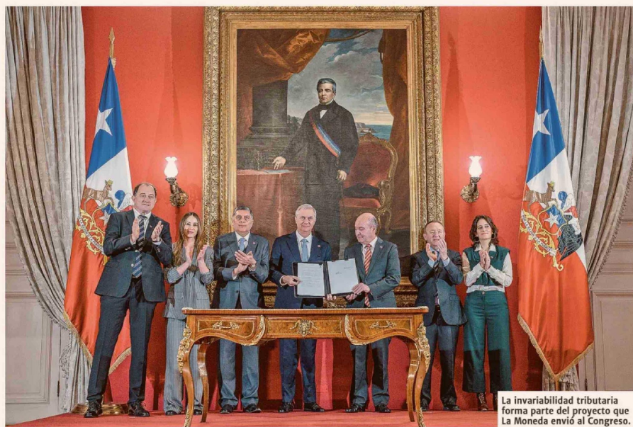
La invariabilidad tributaria forma parte del proyecto que La Moneda envió al Congreso.

riabilidad tributaria y los de derecha más a favor".