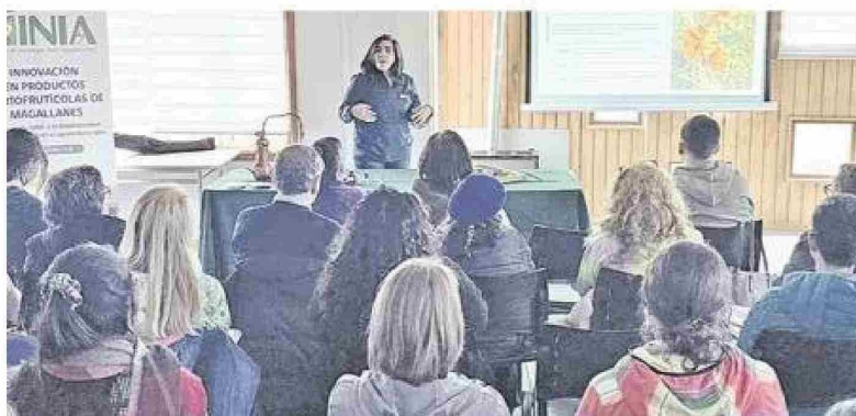
Según Domínguez y colaboradores, estas instancias territoriales cumplen un rol estratégico en la democratización del conocimiento, al transformar las sedes comunitarias en espacios de educación, intercambio de saberes y construcción colectiva de capacidades, entregando herramientas que promueven la innovación local, el pensamiento crítico y el desarrollo con pertinencia territorial.

En un contexto global donde crece el interés por la salud integral, el bienestar y el uso sustentable de los recursos naturales, la Región de Magallanes fue escenario de una significativa jornada de encuentro entre ciencia, territorio y conocimiento ancestral. Con la participación de 68 personas, se desarrolló con éxito el taller "Plantas medicinales y recur-