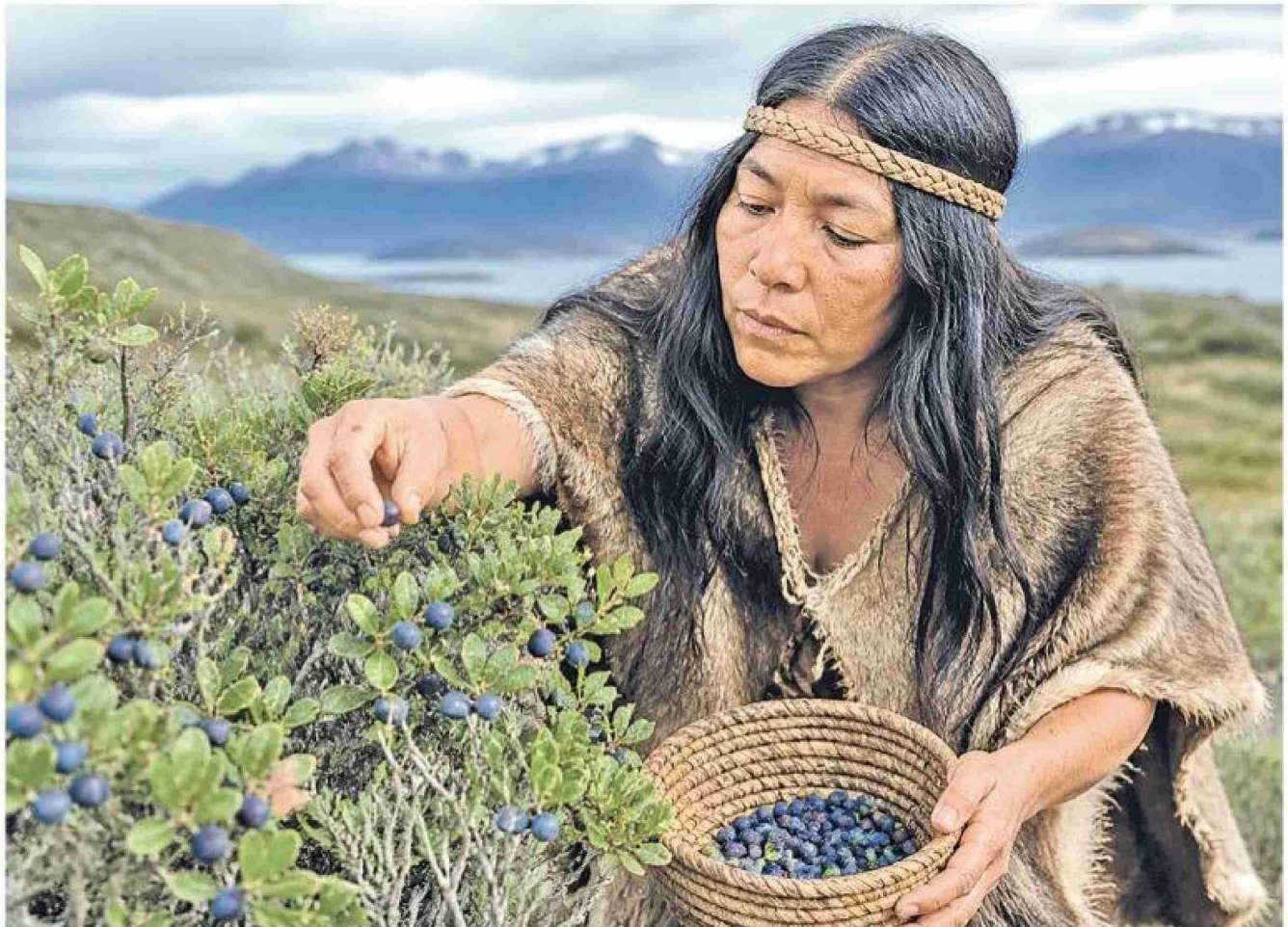
IMAGEN: GENEZIOVA CON LA