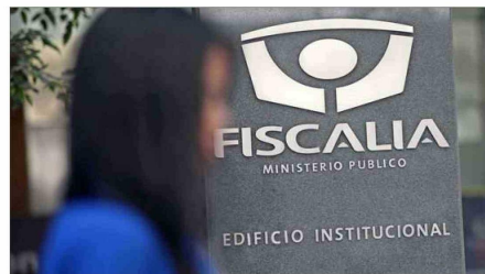
La ley de cumplimiento tributario establece un trabajo más colaborativo entre la fiscalía y el SII.

que el SII haya llevado a cabo la recopilación de antecedentes, el Ministerio Público podrá solicitarlos.