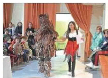
Uno de los disfraces que más llamó la atención.