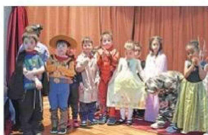
Los alumnos de kínder.