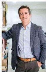
ENTREVISTA | Pág. 10

La agenda del jefe de Corfo: más IA, menos hidrógeno verde