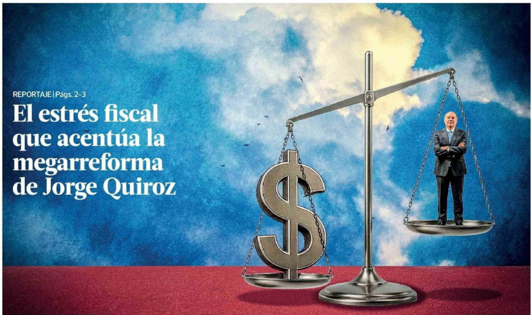
REPORTAJE | Págs. 2-3