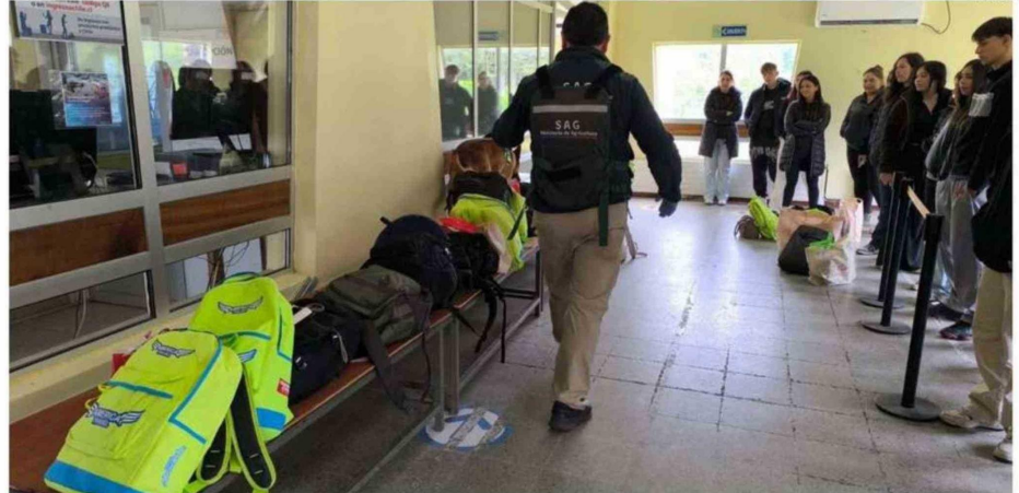
SAMORÉ ES UN PUNTO DE SALIDA E INGRESO PERMANENTE AL EXTRANJERO, POR LO QUE ES MUY IMPORTANTE PREVENIR CON LA VACUNA.

“Hay otras infecciones que causan síntomas muy parecidos, por eso el antecedente de haber viajado, no estar vacunado o haber estado en contacto