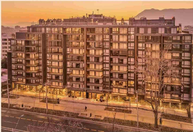
Somma Vista Calán, Las Condes.

Tiraje: 16.150 Lectoría: 48.450 Favorabilidad: No Definida