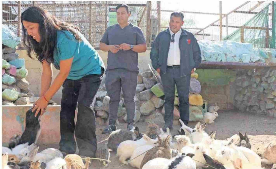
ESTE CENTRO SE HA DEDICADO A SALVAGUARDAR LAS AVES QUE SON DECOMISADAS POR CONTRABANDO EN LA REGIÓN.

En esta situación, y ante la solicitud del Primer Juzgado de Policía Local, desde fines de 2025 la Delegación Municipal de Tarapacá convocó una mesa de trabajo para abordar la situación de este parque de recreación.