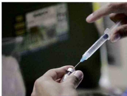
LA CAMPAÑA COMENZÓ EL 1 DE MARZO.

res específicos como avícolas, ganaderas y criaderos de cerdos. En el caso de la vacunación contra neumococo, está dirigida a personas nacidas en 1961 y mayores de 65 años que nunca han sido vacunadas.