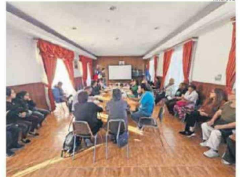
LOS MEDIOAMBIENTALISTAS ESPERAN PARTICIPACIÓN EN EL PROCESO.

Por otra parte, la titular regional del Medio Ambiente, con-