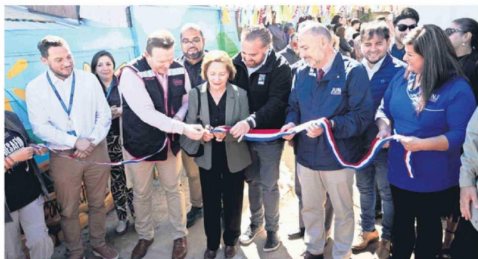
AUTORIDADES JUNTO A VECINOS DE VILLA ITALIA PARTICIPARON DE LA DOBLE INAUGURACIÓN.