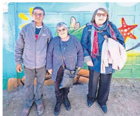
EN LA OCASIÓN TAMBIÉN SE ABRIÓ LA NUEVA SEDE SOCIAL.