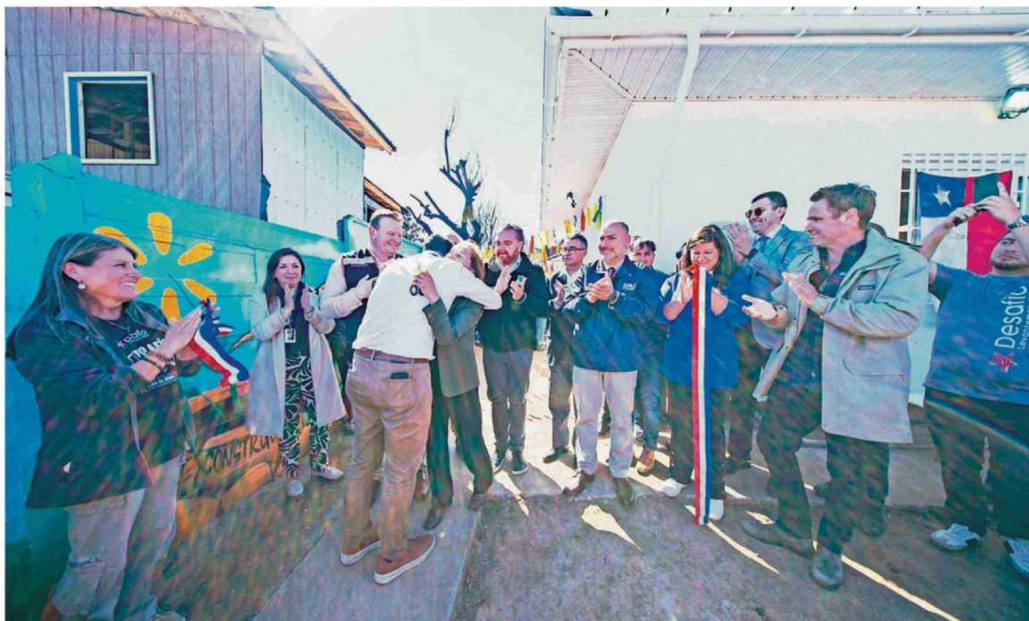
LA INICIATIVA ES FRUTO DE LA CAMPAÑA "DESAFÍO LEVANTEMOS EL SUR" Y FORMA PARTE DEL PLAN DE INVERSIÓN SOCIAL DE US$1 MILLÓN IMPULSADO POR WALMART CHILE.