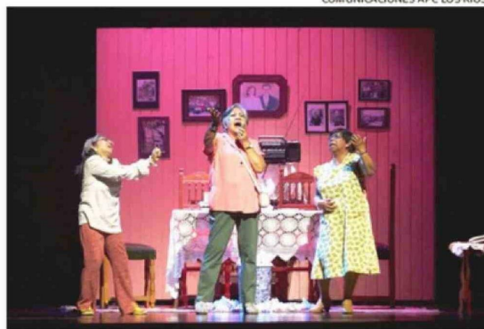
EL MONTAJE DE “RÉPLICAS” SERÁ EL ENCARGADO DE CERRAR LA AGENDA.

co, en su mayoría habitantes de la comuna de Panguipulli.