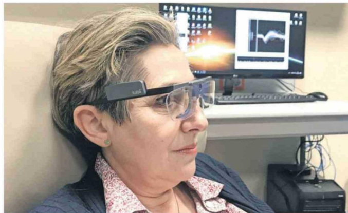
Paciente ciega, con lentes para seguir su mirada y el registro de su actividad cerebral al fondo.

Interfaz permite a personas con parálisis recuperar movilidad o hasta jugar un videojuego. Chile está a la vanguardia de los dilemas éticos de estas herramientas.