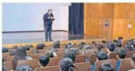
EL FISCAL EN LA REUNIÓN.

“La actividad resultó tremendamente útil, por lo que agradecemos el interés del re-