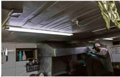
LA AUTORIDAD DICE QUE FALTA EL INFORME DEFINITIVO POR LA LUZ.

que son las que van a tener el mayor alza a nivel nacional", enfatizó.