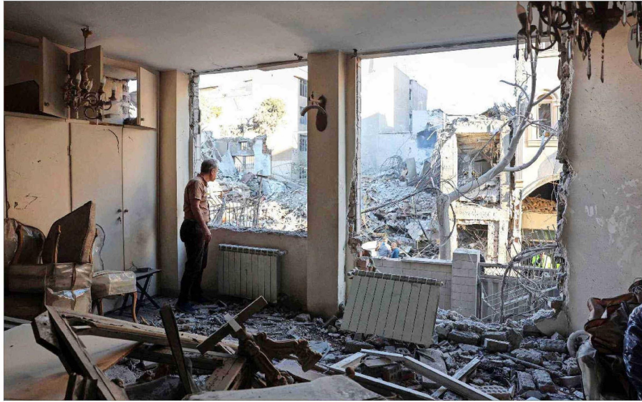
BOMBARDEOS CAYERON sobre Teherán ayer, afectando la sinagoga Rafi Niya y edificios residenciales cercanos, como el de la foto.

Egipto también es otro negociador clave que hizo gestiones