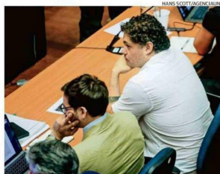
LA FISCALÍA SOSTIENE QUE PROCULTURA NO TENÍA LAS COMPETENCIAS.