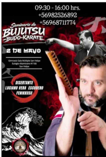
El seminario de Bujutsu, Budo y Karate se realizará el próximo 2 de mayo en San Felipe y estará abierto a toda la comunidad.