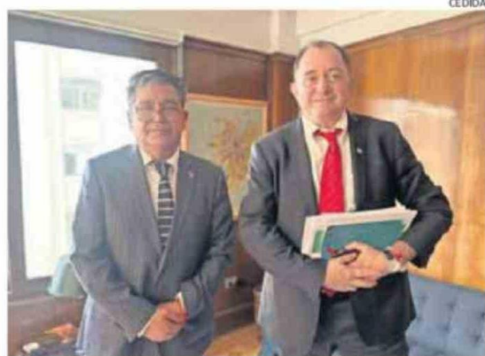
ALCALDE DE CALAMA SE REUNIÓ CON EL MINISTRO, IVÁN PODUJE.

DESAFÍO. El alcalde Eliecer Chamorro informó en Santiago un acuerdo con el Ministerio de Vivienda para impulsar el traspaso de 40 hectáreas y reducir los tiempos de espera de familias inscritas en comités habitacionales.