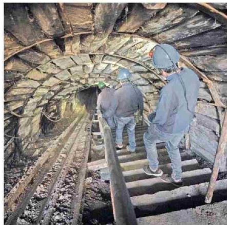
La mina Chiflón del Diablo está actualmente habilitada al público.

tidos, de las tradiciones orales y del folklore local que se ha transmitido por generaciones.