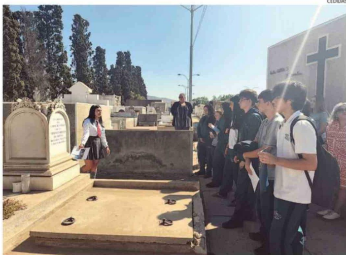
DURANTE UNA JORNADA, EL CEMENTERIO MACAYA SE TRANSFORMÓ EN UNA SALA AL AIRE LIBRE.

La actividad no fue solo un ejercicio académico, sino un intercambio educativo real donde los futuros técnicos en turismo guiaron a alumnos de 3° medio del Colegio Valle del Aconcagua. Bajo el marco del proyecto "Voces del Mayaca", la iniciativa buscó rescatar la tradición oral y fortalecer la identidad local, permitiendo que historias que suelen pasar desapercibidas para la comunidad cobraran vida a través del relato de los jóvenes.