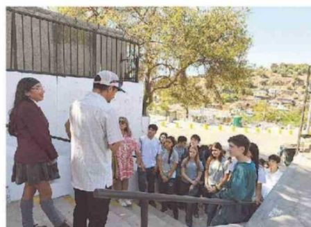
JÓVENES DEL LICEO COMERCIAL FUERON LOS GUÍAS.