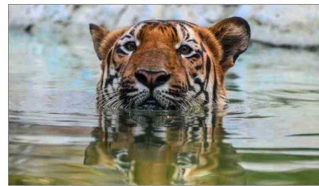
Recientemente, Jai, un tigre de Bengala (animal endémico de India), disfrutando de la piscina que tiene en Jijamata Udyam, el zoológico de Mumbái.