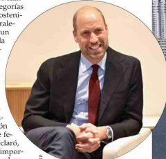
El príncipe William a mediados de mayo.