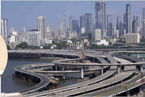
En esta ciudad convive el desarrollo de India con lo más tradicional y característico del país, como los tuc-tucs.