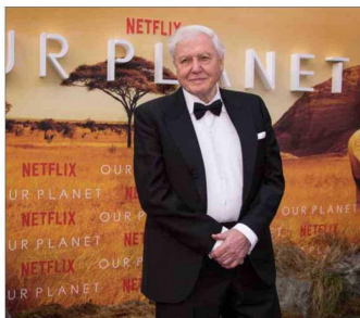
En 2019, para el estreno de la serie “Our Planet”, en el Museo de Historia Natural de Londres, sir David Attenborough. El acaba de cumplir 100 años y es parte del Consejo Asesor de los Premios Earthshot.

“Este premio es el galardón medioambiental más prestigioso del mundo”, expresó Devendra Fadnis, ministro principal de Maharashtra, el estado donde se ubica Mumbái, “y me enorgullece anunciar que se celebrará en Mumbái en noviembre. La sostenibilidad y la acción climática siguen siendo prioridades fundamentales para Maharashtra, y el Premio Earthshot atraerá la atención mundial hacia el liderazgo y el compromiso de la India para convertir nuestros objetivos en acciones concretas sobre el terreno”.