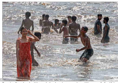
Por estos días se ha advertido una ola de calor extrema en países asiáticos como India y Vietnam, con temperaturas que rondan los 46°. En la foto, un grupo de niños refrescándose a mediados de mes en la playa de Juhu, en Mumbái. El Primer Ministro de India, Narendra Modi, instó esta semana, a través de X, a tomar tantas precauciones como sea posible ante estas temperaturas.