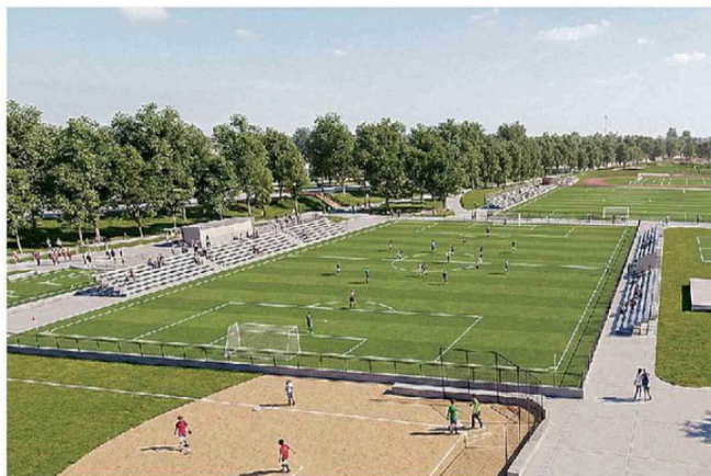
LA REMODELACIÓN DEL PARQUE DYR INCLUYE NUEVAS INSTALACIONES PARA LA PRÁCTICA DEPORTIVA.

oportunidades para potenciar la empleabilidad y el desarrollo de nuestros estudiantes y comunidades en general”.