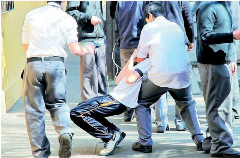
LA REGIÓN DEL BIOBÍO se ubica en segundo lugar nacional con más casos de expulsiones escolares. Pasó de tres expulsiones en 2016 a 158 en 2024.

mientos con alta vulnerabilidad socioeconómica. En 2024, casi dos tercios de las expulsiones se registraron en colegios donde más del 60% del alumnado es prioritario.