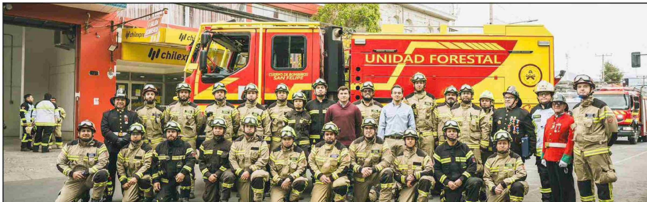
Bomberos junto a su nueva joyita una Unidad Forestal.

Tiraje: 2.900 Lectoría: 8.700 Favorabilidad: No Definida