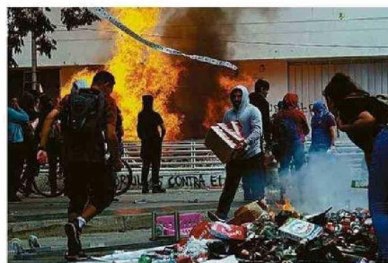
DELINCUENTES APROVECHABAN LAS PROTESTAS PARA SAQUEAR.

gremios del comercio, esa fue una de las iniciativas que se generó en conjunto entre el municipio y el comercio local para poder generar una matriz de abastecimiento en ese periodo".