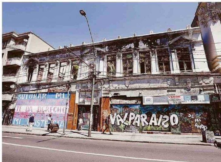
EL EDIFICIO DE CALLE CONDELL DONDE ESTABA EL BANCO ESTADO Y EL LOCAL FIESTA FELIZ SIGUE ABANDONADO.

se inició el estallido social en regiones, un día después del que partió en Santiago. El centro de Valparaíso, en especial la calle Condell, fue uno de los sectores más golpeados.