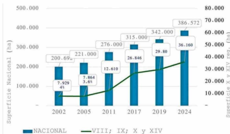
Gráfico: Tendencia de Crecimiento de la superficie frutícola plantada a nivel nacional v/s zona sur (VIII; IX; X y XIV reg.)