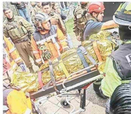
EL LESIONADO PRESENTABA HIPOTERMIA SEGÚN EL HOSPITAL