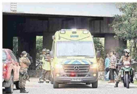
LESIONADO FUE ESTABILIZADO POR FUNCIONARIOS DEL SAMU.

Una unidad del Grupo Especializado en Rescate Subacuático (Gersa) de la Segunda Compañía del Cuerpo de Bomberos de Concepción pudo llegar hasta la posición del auto en el río y llevar a la víctima herida hasta la orilla, para recibir atención médica. Posteriormente fue trasladado a la Unidad de Emergencia del Hospital Re-