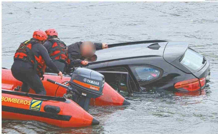
EL CONDUCTOR, CUYO ROSTRO FUE DIFUMINADO, PRESENTABA EVIDENTES HERIDAS EN SU ROSTRO Y EN SUS MANOS TRAS EL ACCIDENTE.

años tenía aproximadamente el conductor del auto que se accidentó en el puente.