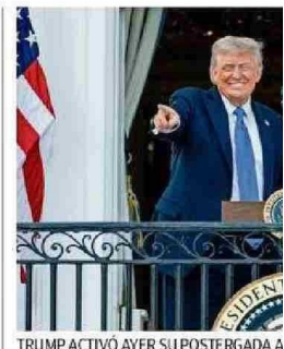
TRUMP ACTIVÓ AYER SU POSTERGADA A

Trump, que siempre ha presumido de una buena relación con Putin, ha expresado en las últimas semanas frustración por la negativa de Rusia de parar los combates e incluso calificó de "loco" al jefe del Kremlin, pero no ha materializado su amenaza de imponer nuevas sanciones a Moscú. CE