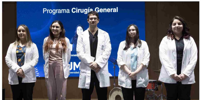
PARTE DE LOS PROFESIONALES QUE INICIARON SU FORMACIÓN DE ESPECIALIDAD EN MAGALLANES.

6 cupos entre las tres especialidades se abrieron en la Universidad de Magallanes.